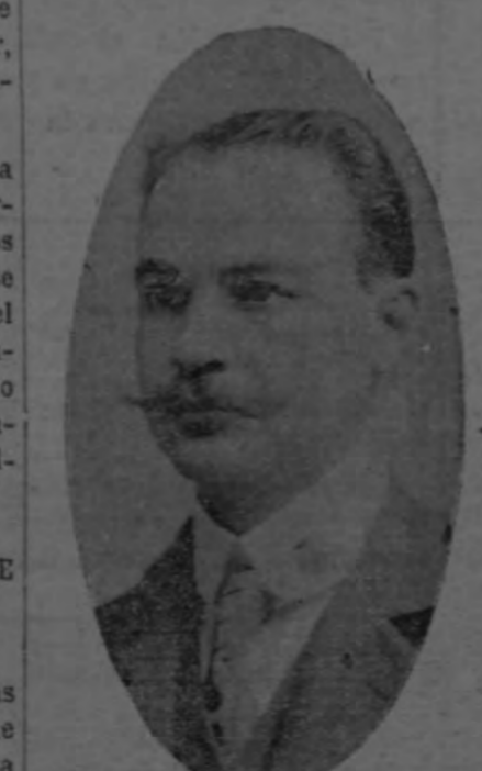
LIC. D. MANUEL ECHEVERRIA actual Gobernador de la Provincia de San José.

Hé ahí el punto convergente de la cuestión; sin embargo, estamos informados, después de obtener los anteriores datos que ponen de relieve la actividad en que se halla este asunto, que la casa Lawrence Turnur y Co., de New York está dispuesta á aceptar la proposición de la Municipalidad de San José hasta por dos millones de dólares con garantía de las rentas municipales y fianza subsidiaria de Gobierno. Esta última exigencia, que parece dura ya que las rentas municipales alcanzan bien para un servicio de ese tamaño, se debe á la falta de confianza que en Estados Unidos se tiene por los Bonos Municipales, pues con excepción de los de Nueva York y otras ciudades importantes de los Estados Unidos, los Municipios no han mostrado ser deudores muy aceptables, y en consecuencia para poder inducir á la compra de Bonos Municipales, es preciso revestirlo de la garantía subsidiaria del Gobierno.